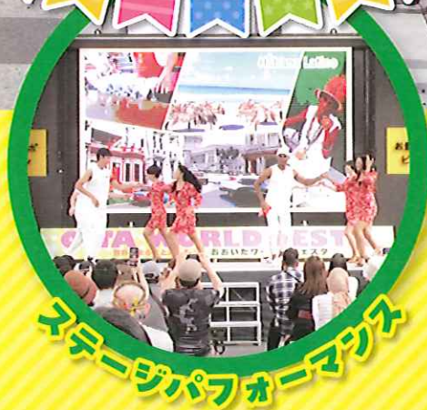
スモーグパフォーマワズ