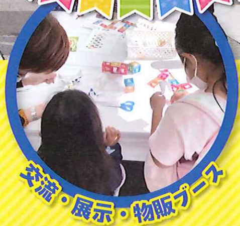
交流・展示・物販ブース